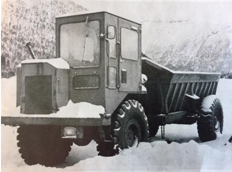
Prototype fra 1970