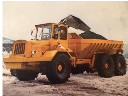
Tidlig modell fra 1975